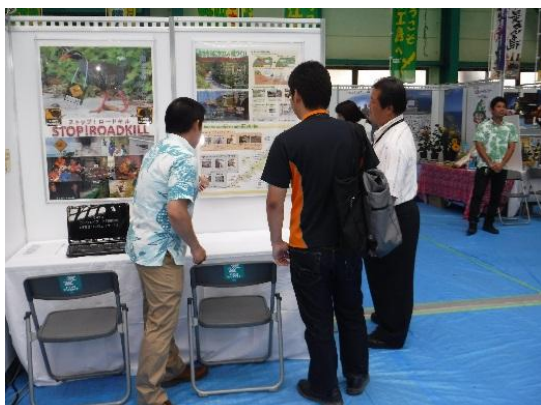
ロードキル対策ではカニさんトンネルやクイナフェンスに関心が集まりました。