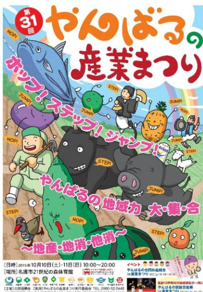
【第31回やんばるの産業まつりポスター】