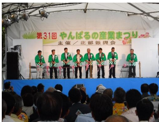
オープニングセレモニーでのテープカット