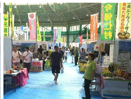
会場の様子(他ブース)