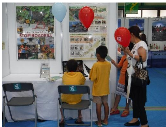
ヤンバルクイナの動画を観察する子供達