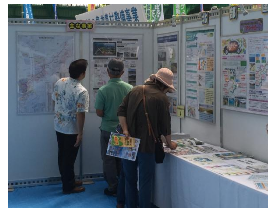
名護東道路について、どこに繋がるのか関心を示す人が多く見られました。